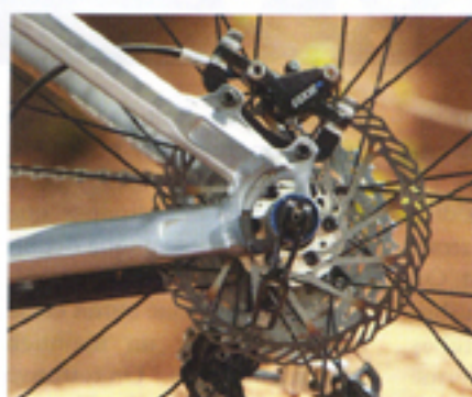
Le travail au niveau du cadre est magnifique, comme ici les pattes arrière ajourées. Vu aussi le nouvel axe Maxle Lite et les Avid anodisés ?

l'obstacle sans broncher. A l'assaut du dénivelé positif, le Reign X0 ne fait pas la gueule pour autant, car son excellente motricité lui permet, encore et toujours, d'être bien rivé au terrain, sans patinage approximatif. Pour l'occasion, ses pneus assez souples se révèlent de bons alliés, ce qui ne sera pas forcément le cas dans la caillasse coupante. Sur une vraie spéciale d'enduro, alternant portions rapides, très techniques, et grimpettes sèches, le Giant n'est jamais pris en défaut, avec tout