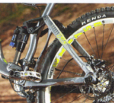
Fidèle à la suspension Maestro couplée avec un Fox DHX Air, le Reign X0 est un monstre d'efficacité.