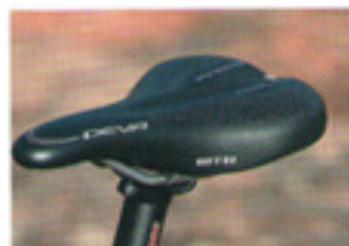
Très bon choix de selle sur le Cypher avec cette WTB Teva.

Voici la première édition du Cypher, un tout-suspendu déjà réellement abouti.