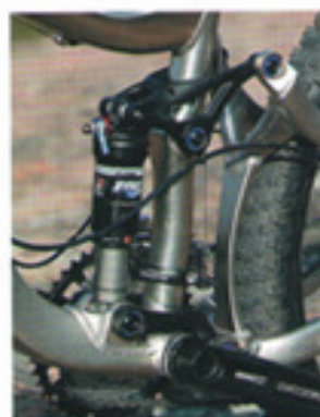
L'amortisseur Fox Float passe en Pro Pedal (plus ferme) via la molette bleue et tout en roulant. Mais le système Maestro est si efficace, que jamais on ne pense à le fermer !

minutes de roulage, on oublie vite cette géométrie ramassée et on se sent à l'aise sur le Cypher. Il gagne en maniabilité, l'avant est vif, il se faufile partout avec beaucoup d'aisance. Mieux encore, il ne perd rien en stabilité puisque son angle de fourche est largement ouvert. Bref, le parfait compromis. La position est vraiment confortable, la selle également, mais ce qui est encore plus enthousiasmant, ce sont ses suspensions!