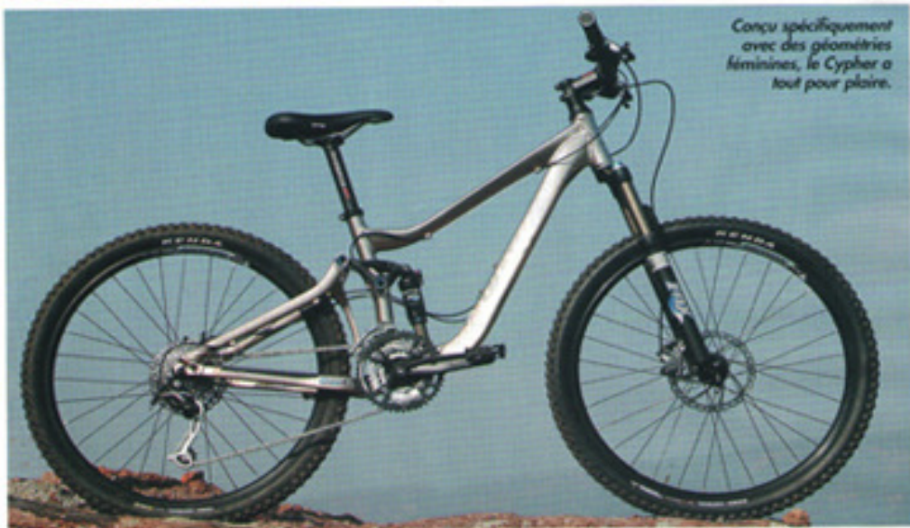
Conçu spécifiquement avec des géométries féminines, le Cypher a tout pour plaire.

On n'avait jamais vu pareille couleur sur un VTT! On sort enfin des traditionnels coloris pastel rose bonbon ou bleu azur et des petites fleurs, avec cette robe dorée. Quelle classe ! Ce cadre vernis n'a en plus, au fil des sorties, présenté aucun éclat sur le cadre. Tant mieux ! Côté déco, on relève sur le cadre un petit tatouage tribal, qui permet d'identifier tous les VTT femmes de chez Giant. Côté équipement, là encore, que du beau: des suspensions Fox, une selle spécifique femme qui ne s'apparente pas à un fauteuil, un guidon Race Face à la bonne largeur de nos épaules... Quant à l'essai de ce Cypher, on frise là encore la jubilation! Question position tout d'abord, on est surpris par la taille du cadre, toute ramassée: le tube supérieur est en effet bien plus court comparé à ceux des VTT traditionnels, puisque notre buste de femme est plus petit. On aurait préféré une taille supérieure, mais chez Giant, on nous assure que le XS pour mon mètre soixante-trois est à la bonne taille. Ce qui se vérifiera sur le terrain. Passées les premières